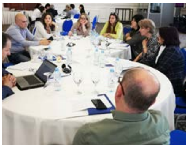
Фотографии 7, 8, 9 и 10: Дискусии за време на групната работа